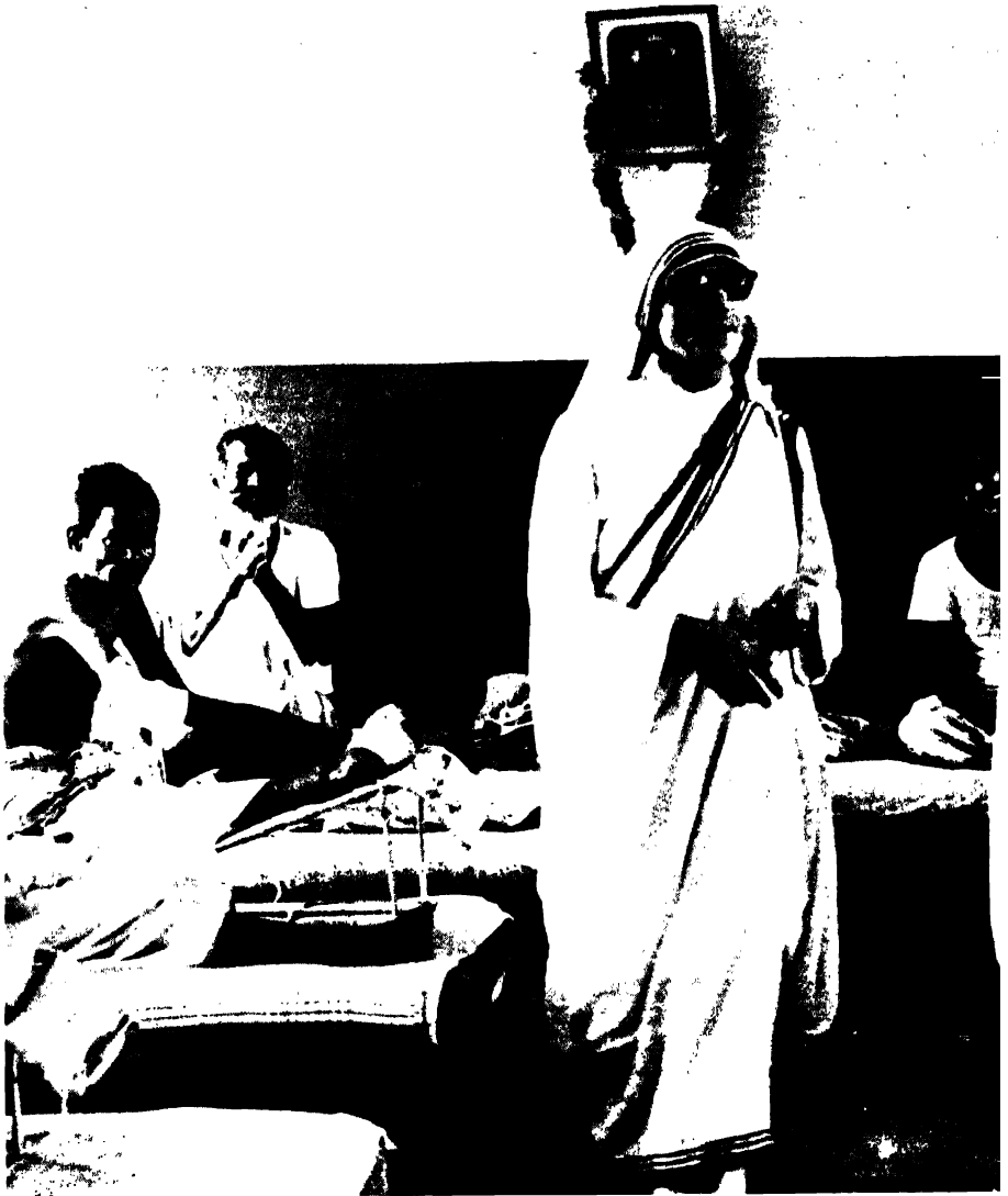
कोदुलागेका रोगीहस्तित ढदर टेरेजा